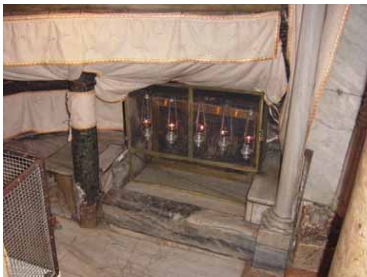
A jászol helye