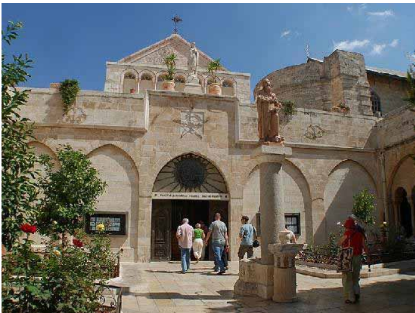
A Szent Katalin templom (a Születés Bazilikája mellett)

Régebben a betlehemezés a legismertebb és legelterjedtebb karácsonyi szokások közé tartozott, amely egy több szereplős dramatizált játék volt és az egész országban ismertek, nagyon sok helyen ma is