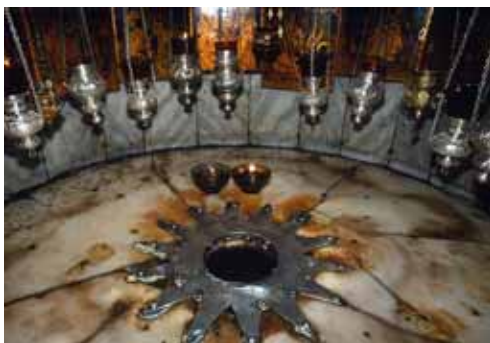
14 ágú csillag a születés helyén

A templom szíve a Születés barlangja. A kórus két oldaláról egy-egy lépcső vezet le a puha mészkösziklába vájt barlangba, amely majdnem téglalap alakú, 12 méter hosszú és 3 méter széles. Padlóját és falait szép márványlapok fedik. A sötét barlangot 53 lámpa vi-